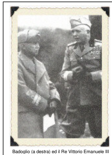
Badoglio (a destra) ed il Re Vittorio Emanuele III

Testo del comunicato radio letto dal Maresciallo Badoglio l'8 settembre '43 "Il Governo Italiano, riconosciuta la impossibilità di continuare la impari lotta contro la soverchiante potenza avversaria, nell'intento di risparmiare ulteriori e più gravi sciagure alla nazione, ha chiesto l'armistizio al generale Eisenhower comandante in capo delle forze alleate anglo-americane. La richiesta è stata accolta. Conseguentemente ogni atto di ostilità contro le forze anglo-americane deve cessare da parte delle forze italiane in ogni luogo. Esse però reagiranno ad eventuali attacchi da qualsiasi altra provenienza."