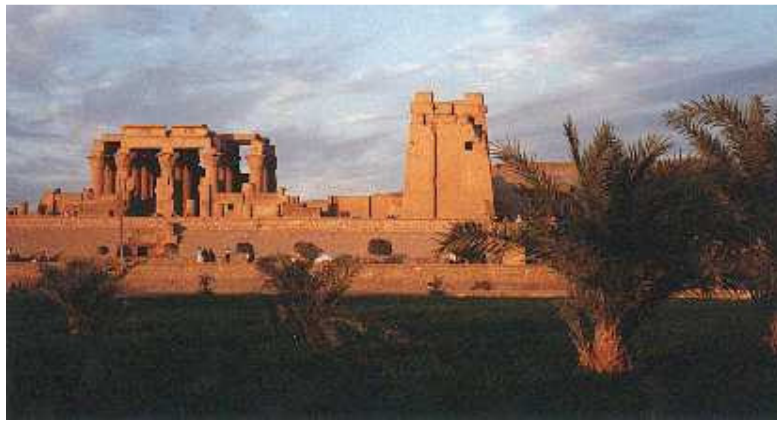
Tempio di Horus e Sobek A Kom Ombo (Egitto) Epoca Tolemaica

In questo senso, unico e promiscuo era anche l'ambiente in cui queste discipline si esercitavano, che poteva andare dalla semplice capanna dello sciamano, al bosco di querce del druido, allo splendido tempio e alla città sacra delle civiltà più evolute. In un'unica figura carismatica o al massimo in una cerchia molto ristretta, convergevano i ruoli del maestro, del sacerdote, del filosofo, dello scienziato, del medico.