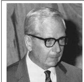
Alessandro Passerin d'Entrèves

Alla fine solo ad un contingente simbolico di francesi poté inoltrarsi nella valle per raggiungerne il capoluogo, dove però intanto si era ormai già insediato, sotto tutela americana, il nuovo prefetto partigiano nominato dal CLNAI Alessandro Passerin d'Entrèves che preparava le difese cittadine richiamando sia i partigiani sia i soldati della Repubblica Sociale per proteggere la città da un eventuale colpo di mano francese. Alle operazioni contro i francesi presero parte anche gli alpini dei battaglioni "Varese" e "Bergamo" del Reggimento alpini della Divisione "Littorio" dell'ormai disciolto Esercito Nazionale Repubblicano.