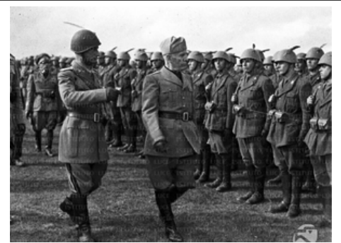
Il 16 luglio 1944 Benito Mussolini passa in rassegna la "Monterosa" a Münsingen.

La Divisione alpina "Monterosa" non fu riconosciuta ufficialmente nei raduni degli ex-alpini; pertanto coloro che avevano combattuto unicamente in questa formazione, secondo l'ANA, non potevano fregiarsi del titolo di alpini, ma il 27 maggio 2001 l'Associazione Nazionale Alpini decise di annullare questa discriminazione di carattere soprattutto politico, approvando una delibera che andava in questo senso: "L'Assemblea dei Delegati, preso atto e confermata la validità di tutto quanto precedentemente deliberato in merito alla Divisione Monterosa e altri simili della Repubblica Sociale Italiana, dichiara e riconosce che tutti i giovani che hanno prestato servizio militare in un reparto Alpino, in qualsiasi momento della storia d'Italia, e quindi anche dal 1943 al 1945, poiché hanno adempiuto il comune dovere verso la patria, siano considerati Alpini d'Italia."