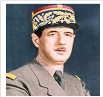
Il generale Charles De Gaulle

Nell'agosto '44 gli Alleati sbarcarono in Provenza (operazione Dragoon), e avanzarono rapidamente verso nord. I Tedeschi si ritirarono sul fronte alpino presidiando i valichi al confine con l'Italia. Con duri combattimenti, i Francesi liberarono Briançon e avanzarono nella valle della Maurienne fino a Modane, arrestandosi a causa del sopravvenuto inverno.