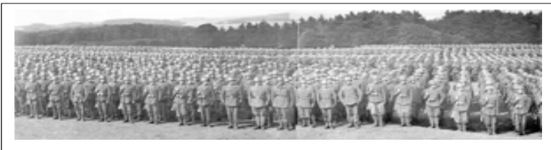
La "Monterosa" schierata al completo

Le forze italiane dislocate sul confine occidentale erano formate principalmente da ciò che restava delle divisioni dell'Esercito della RSI "Monterosa" e "Littorio", che erano state addestrate in Germania prima di essere schierate sul fronte e avevano armi tedesche e italiane, con cannoni e mitragliatrici principalmente italiani, e artiglieria principalmente tedesca.