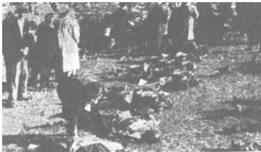
Fasi del pietoso riconoscimento

Terminano così le estrazioni "con i seguenti dati finali: giorni di lavoro n. 8; discese effettuate n. 9; salme di vittime estratte n. 84. Fra queste 3 donne, 1 giovane di 18 anni e 12 militari germanici".