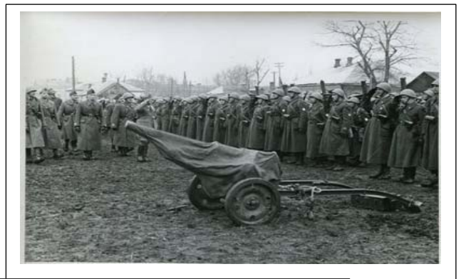
Soldati della Legione Croata. A destra li passa in rassegna il Gen. Messe