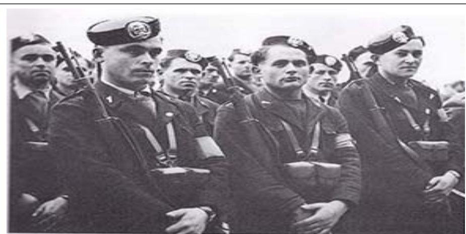
unità Della Milizia Volontaria Anticomunista (MVAC).

Dal 1941 fino alla capitolazione d'Italia nel settembre 1943 queste bande furono ufficialmente riconosciute ed impiegate (a volte direttamente inquadrare) dal Regio Esercito italiano quali truppe ausiliarie per la difesa e la sicurezza della Provincia di Zara ed altri territori del Montenegro, Dalmazia, Bosnia ed Erzegovina e Slovenia sotto amministrazione o controllo italiano. Il Regio Esercito schierò molte bande, battaglioni e legioni, mentre la Banda n. 9 "della Marina", formata da greco-ortodossi e da giovani italiani nativi della Dalmazia, era alle dipendenze della Base della Regia Marina: indossavano la divisa da fatica dei marinai e il basco blu; operò a fianco di una compagnia del Reggimento "San Marco".