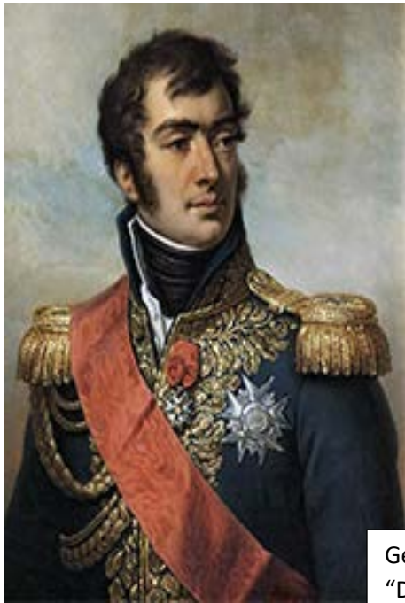
Gen. Auguste Frédéric Louis Viesse de Marmont "Duca di Ragusa"

Anche la gloriosa Repubblica di Ragusa fu occupata dalle truppe del Generale napoleonico Marmont, che era stato inviato in Dalmazia a prendere possesso della regione. Per cinque anni fu governatore civile e militare della Dalmazia. Nel 1808 Marmont ottenne il titolo di "duca di Ragusa". Il Congresso di Vienna, come per Venezia e Genova, non restituì l'indipendenza alla Repubblica, tradendo anche qui il "principio di legittimità".