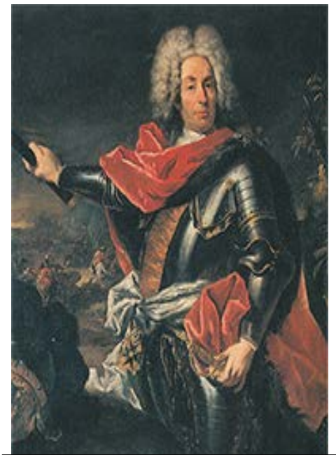
Johann Matthias von der Schulenburg

https://www.youtube.com/watch?v=XhMhFK71bVk