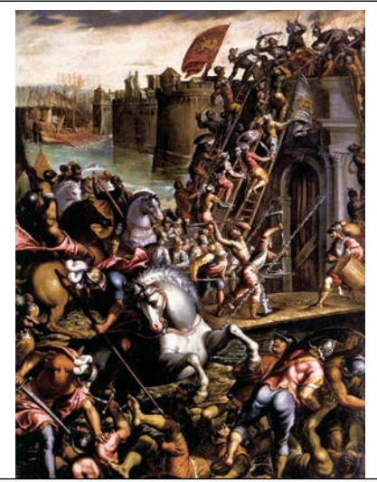
L'assedio di Zara, di Andrea Vicentino (1539-1614)

Dopo l'iniziale proclamazione da parte di papa Innocenzo III (1198), la quarta crociata (1202-1204) partì in ritardo a causa di numerosi disaccordi tra i poteri cristiani. Venezia aveva fornito gran parte delle navi impiegate nel trasporto di più di 30.000 uomini (circa 1200 navigli), chiedendo il pagamento di 85000 marchi d'argento. I crociati, però, non erano in grado di pagare quanto pattuito. Il pragmatismo veneziano fece escogitare una particolare forma di pagamento: Il doge di Venezia Enrico Dandolo confermò il trasporto in cambio dell'aiuto nella riconquista della città dalmata di Zara, ribellatasi nel 1183 all'autorità veneziana e postasi sotto la protezione del papa e del Regno d'Ungheria Croazia e Slavonia guidato dal potente e bizantineggiante sovrano Béla III Arpád, che vi aveva fatto affluire un importante contingente militare. Anche Pisa si era schierata a difesa di Zara. Poiché i crociati acconsentirono alla conquista di Zara (1202), Innocenzo III li scomunicò, per aver attaccato una città cristiana, ma concesse poi il perdono purchè si procedesse per la crociata.