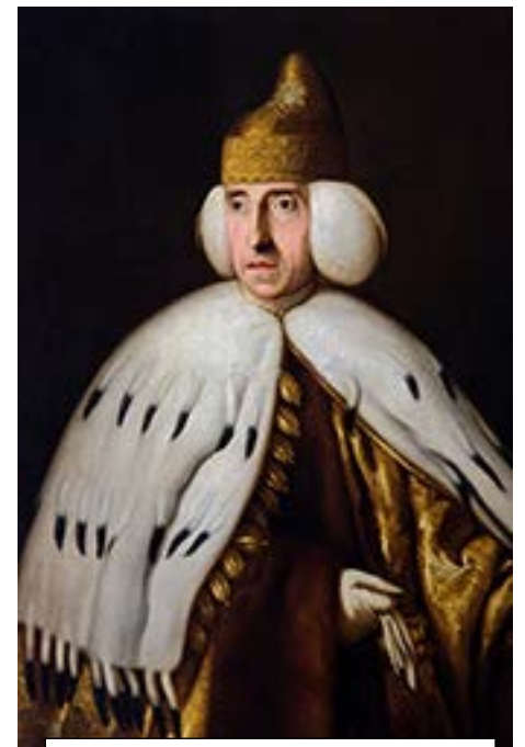
l'ultimo doge Ludovico Manin

Il Bucintoro, nave simbolo della Serenissima, fu dato alle fiamme e affondato nel bacino di San Marco