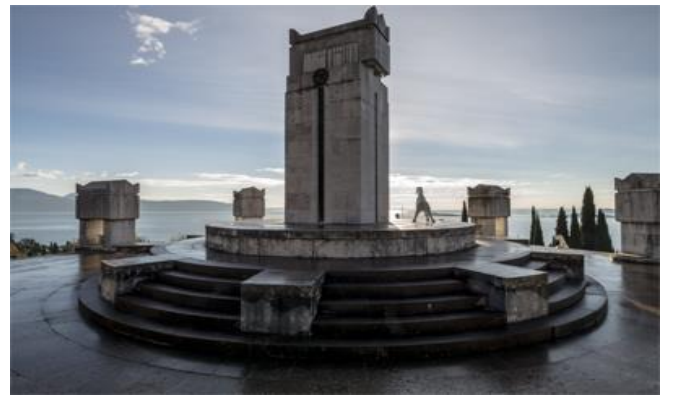
La tomba di D'Annunzio, circondata da 10 urne di pietra

Video della tumulazione delle spoglie di Riccardo Gigante