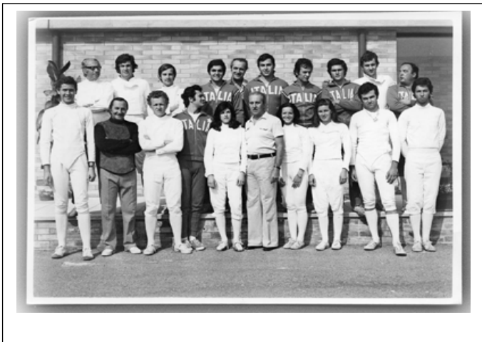
1973: partenza per le Universiadi di Mosca