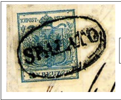
Il primo francobollo annullato a Spalato (1851). Il timbro è in italiano