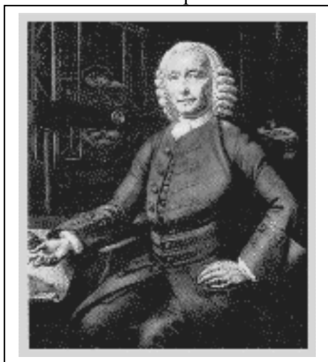
John Harrison (1693 - 1783)

Anche nel ricordo di quel tragico naufragio, il Parlamento inglese l'8 luglio 1714 emanò il Longitude Act, con in quale stanziava l'immensa cifra di 20.000 sterline (vari milioni di euro) per chi avesse elaborato un metodo sufficientemente preciso per calcolare la Longitudine. Il problema era antico, ma per secoli era stato affidato a sistemi empirici e soprattutto alle personali capacità marinare dei singoli capitani. Ben prima che giungesse la prospettiva di un premio in denaro, il calcolo della Longitudine aveva stimolato scienziati famosi, da Galileo a Newton e Halley. L'appartenza dei più illustri fra questi al campo dell'Astronomia oltre che l'antico e consolidato rapporto dei marinai con sole, luna e stelle, avevano però generato la certezza che anche il problema della Longitudine avrebbe trovato soluzione attraverso l'Astronomia.